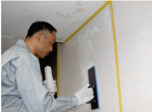
カビ部分を先にクロスアートを下塗りします