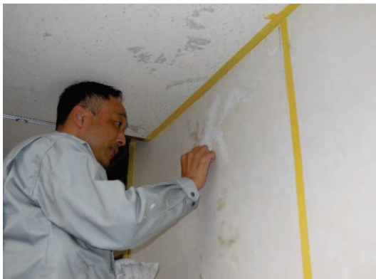
クレパスを使ってカビの上を白く塗ります