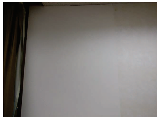
乾燥後はカビも汚れも消え綺麗になります