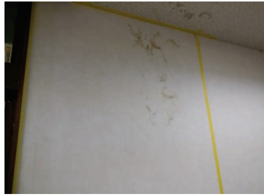
解りやすくテープで区切りました