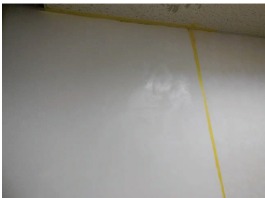
乾燥するまで待ちます