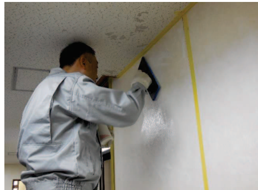
下塗り乾燥後クロスアートを全体に本塗りします