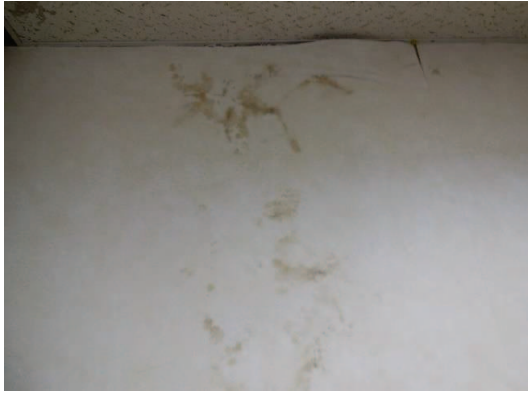
クロスにカビが発生しています